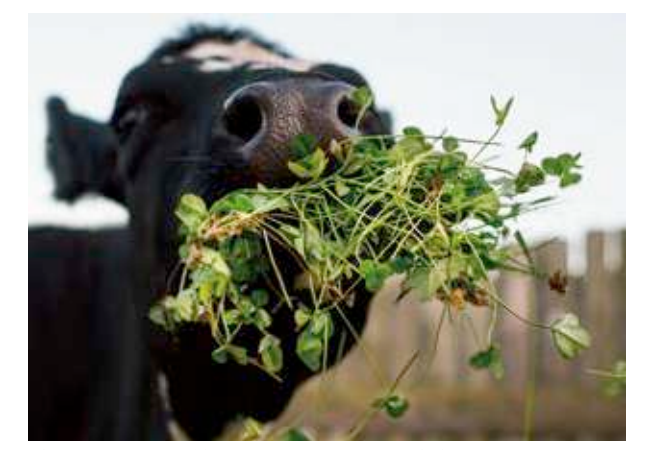
草を食べるウシ。大きな胃に、たくさんの細菌がすんでいます。

草や葉はせんいがおおくと、消化しにくい食べ物です。植物を専門に食べる動物でも、自分の消化液では、せんいを分解することができません。そのため、植物食動物は胃や腸（盲腸や結腸などの大腸）に植物のせんいを分解して発酵させる細菌などの微生物を何種類もすまわせ、消化のたすけをしてもらっています。これらの微生物は、肉食動物や人間のような雑食性の動物の腸にもすんでいます。