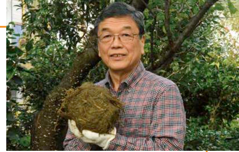
アフリカゾウのうんちを調べる監修者。

うんちは、体の外に出した不要なもの……それだけではありません。動物たちが、なかまやライバルと情報をやりとりするときや、消化しにくい植物せんいを分解して消化をたすける細菌などを、生まれた子どもに受けわたすときなどにも、うんちが利用されます。動物園でも、動物たちのうんちはとてもたいせつなもので、「うんちチェック」は飼育係の朝いちばんの仕事です。うんちから、健康や精神状態、食欲があるかないかなどがわかるからです。うんちには、たわら形、ソラマメ形、コロコロ形など、個性ある形があり、よく観察して「うんち