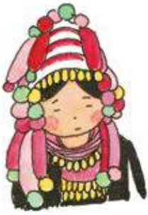
民族衣装を着たミャンマーのアカ族の女性

ビルマ独立記念日 一九四八年、イギリスから独立してビルマ連邦共和国が成立、共和制国家となった。その後、一九八九年六月、軍政側によりビルマからミャンマーと国名を変更。現在でも一部ではビルマの国名が使われているんだ。