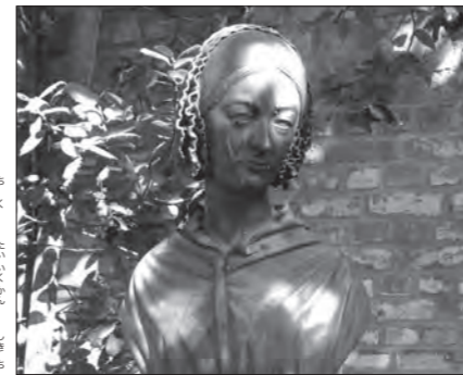
カイゼルスベルト地区の体育館の敷地にあるナイチンゲールの胸像

ナイチンゲールが看護を学んだ看護師訓練所とは、ドイツのフリードナー牧師がドイツ西部の都市、デュッセルドルフに開いたカイゼルスベルト学園です。彼は、牧師としてカイゼルスベルト地区の担当になると、そこに住む貧しい人々の状況に心を痛めました。また、当時は罪をおかした受刑者のあつかいがひどく、なかでも女性のおかれていた立場を改善する必要性も強く感じていました。そこでフリードナー牧師は、1833年、刑務所を出た女性を立ち直らせるための施設と、貧しい人のための病院をつくりまします。さらに1836年に設立したのが、