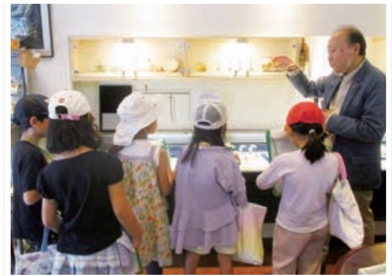
宝石やさんにインタビューしたときに「カメラ係」が撮影した写真。

みんなは、このまち探検で知ったことやわかったことをまとめて1年生に発表する予定です。まとめ方は、「大きな紙や新聞!」「タブレットをつかいたいな」「かるたもいいね」などと、みんなで相談して決めます。