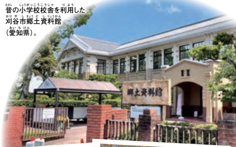
むかし 昔の しやう 小学校 がく う 校舎 を り よ う した かり や し せ つ とし り よ う かん 劉 谷 市 郷 土 資 料 館 (あ い ち けん 愛 知 県)。