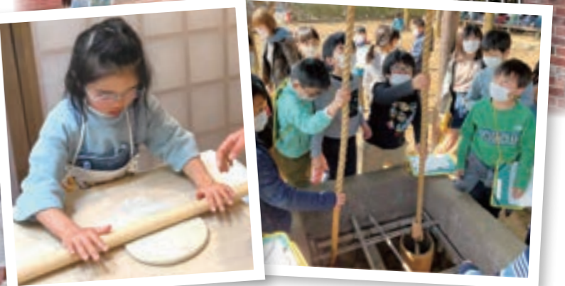
きょうど 郷土資料館 では、 むかし 昔の せい 生活 につ か わ れ て い た どう ぐ 道具 を じ っ さ い に つ か つ た り、 そ の ち いき 地域 なら では の たい げん 体験 が でき る こ と も 多 い。 しや しん 写真は ち い き と く せん 地域 と く さん の そ ば を つ か つ た そ ば う ち たい げん と、 い ど 井戸 の しく み たい げん。

パンフレット、リーフレット、チラシ なんまいもの紙を重ねてとした「冊子」のうち、ページが少なめのものがパンフレット。冊子ではなく1まいの紙をおりたたんだものがリーフレット、1まいの紙に情報をまとめたのがチラシ。