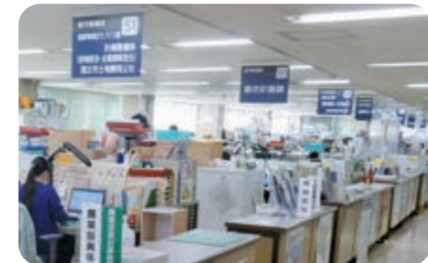
しやくしょ 市役所 ない 内部。 おほ 大きく 「ぶ」 や「か」 が表示 されて いる。 どの 部 や 課 が郷 土に かん けい する しごと を して い る か は、 やく しょ 役所 に よ っ て こ と な る。

「郷土資料館」などとよばれる施設 が つ く ら れ て い る こ と も 多 く あ り ま す。 そ う し た やく ば 役場 や し せ つ 施設 でし ごと を し て い る ひと に、「 ま ち じ ま ん」 につ いて いん た び ゅ ー し て み ま し ょ う。