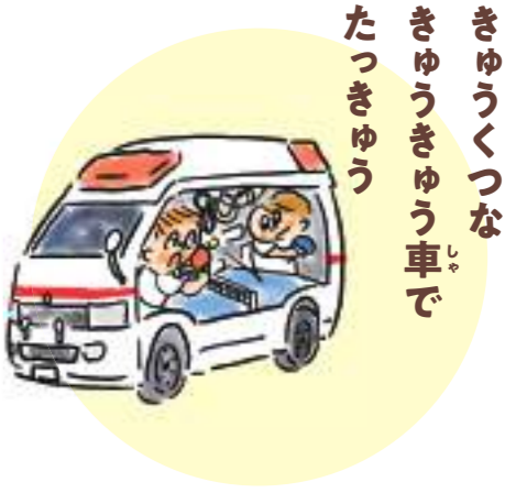
きゆうくつな きゆうきゆう車で たつきゆう