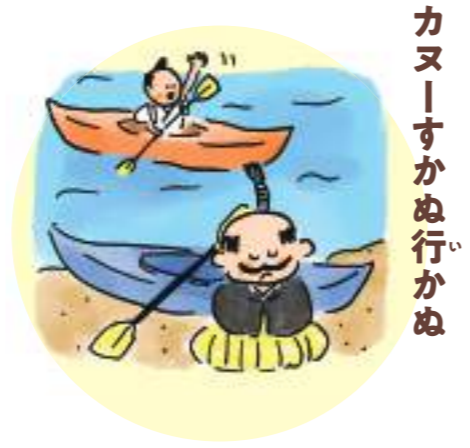
カヌーすかぬ行かぬ