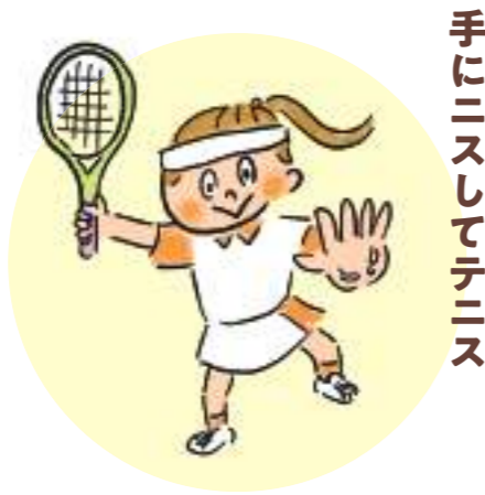
手にニスしてテニス