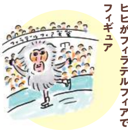
ヒビがフィラデルフィアで フィギュア