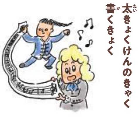
太きよくけんのきやく 書くきよく