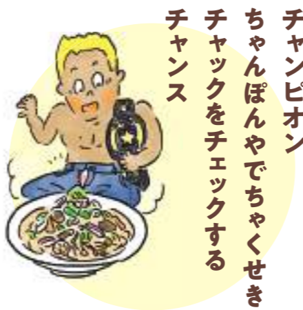
チャンピオン ちゃんぽんやでちゃくせき チャックをチェックする チャンス