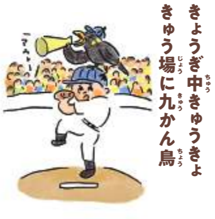
きようぎ中きゆうきよ きゆう場に九かん鳥