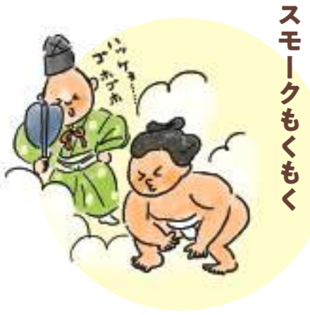
すもうもうすぐ スモークもくもく