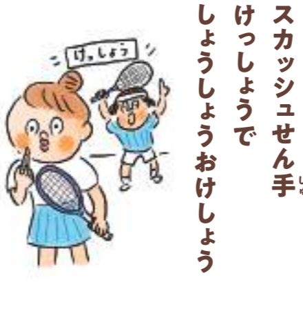
スカッシュせん手 けっしょうで しょうしょうおけしょう