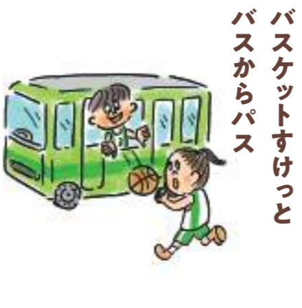
バスケットすけっと バスからバス