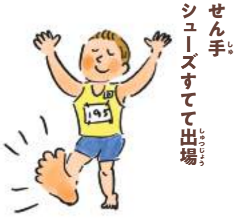
せん手 シューズすてて出場