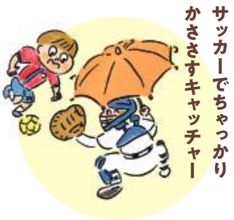
サッカーでちゃっかり かささすキャッチャー