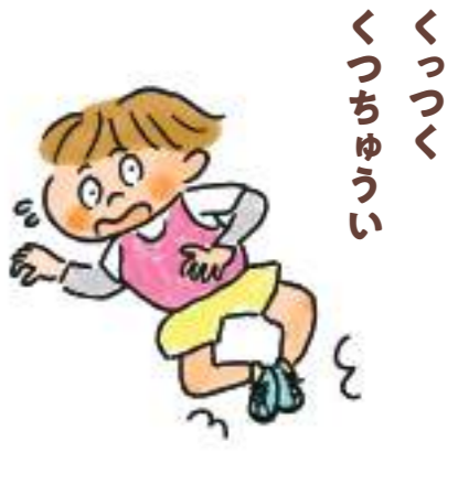
くつつく くつつちゆうい