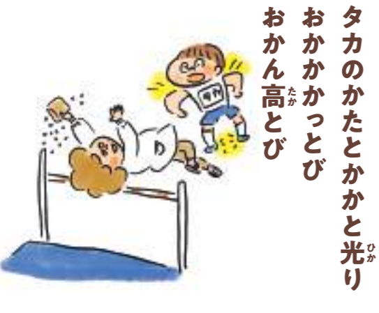
タカのかたとかかと光り おかなかつとび おかん高とび