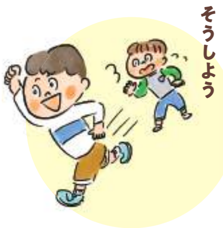
今日きようそうしよう そうしよう