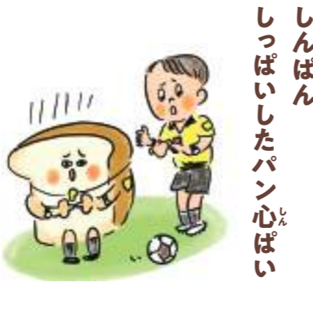
しんばん しっぱいしたパン心ばい