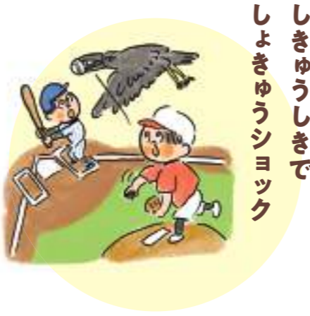
しきゆうしきで しよきゆうシヨック