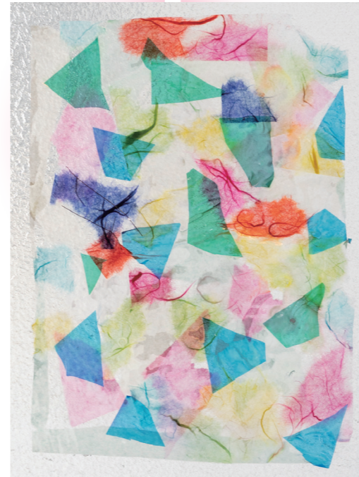
ひかり 光がすける色紙