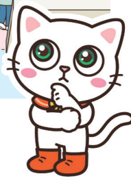
東京都新宿区立津久戸小学校の例