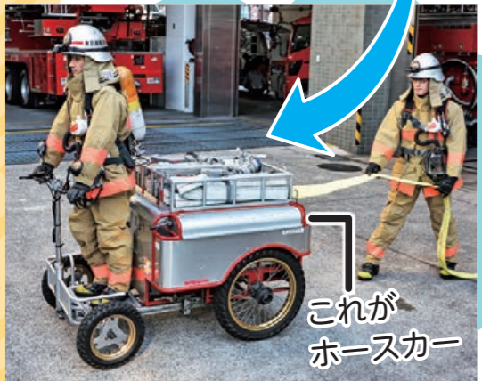
これがホースカー