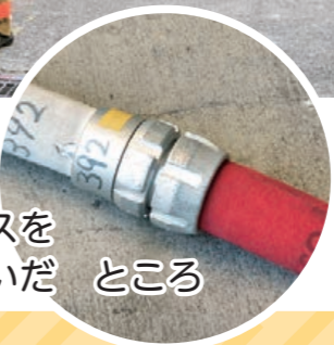
ホースをつないだところ