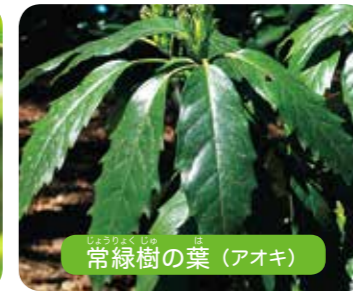
常緑樹の葉 (アオキ)