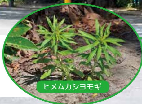
ヒメムカシヨモギ