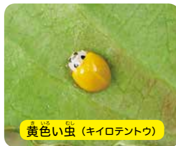
黄色い虫 (キイロテントウ)