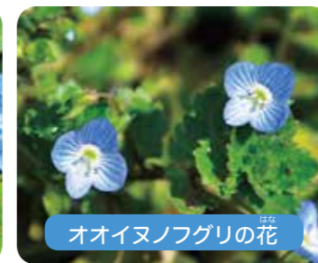
オオイヌノフグリの花