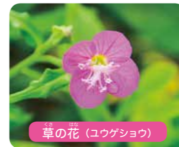
草の花 (ユウゲショウ)