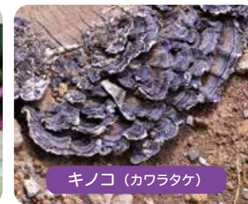
キノコ (カワラタケ)