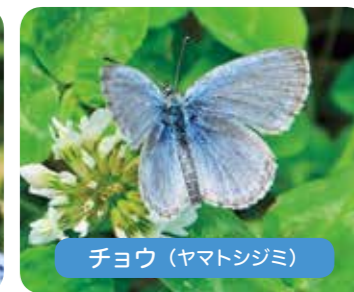
チョウ (ヤマトシジミ)