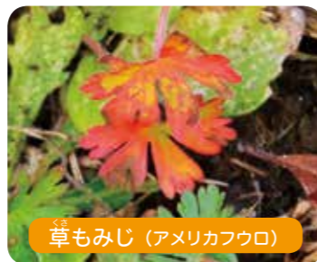
草もみじ (アメリカフウロ)