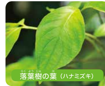
落葉樹の葉 (ハナミズキ)