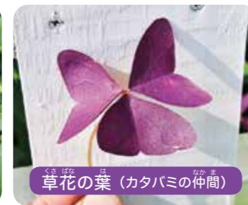
草花の葉 (カタバミの仲間)