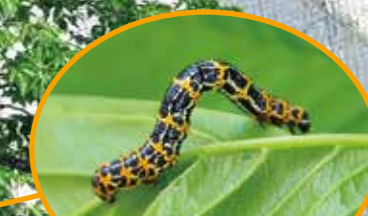
ウメエダシャクの幼虫