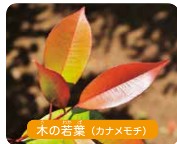
木の若葉 (カナメモチ)