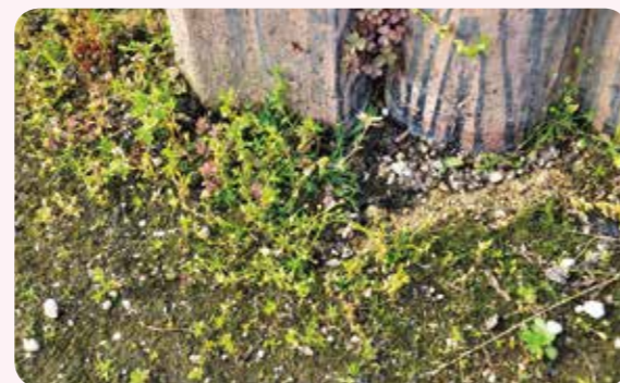
ブロックのまわりやすきまは生きものが多い。

花だんのまわりで、どんな生きもののかんさつできるかな？ 植えられた花と、勝手に生えてきた草の区別ができるかな？ 花だんで見つけた虫や植物をならべてみました。